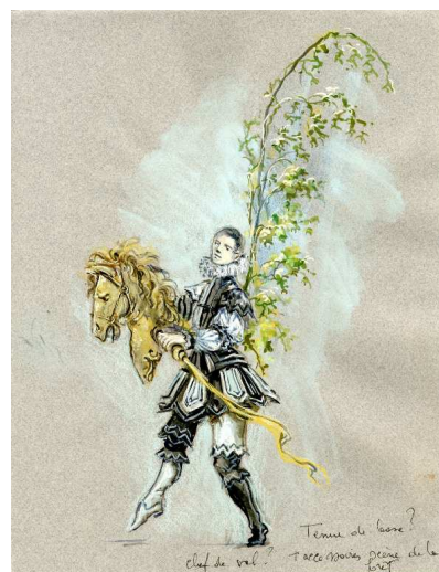
La Merlaison © Thierry Bosquet