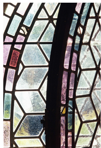
Détail des vitraux de Royaumont

Du côté de l'histoire, Fabrizio Cassol a choisi d'ajouter un rôle qui n'existe pas dans l'œuvre de Bach, celui de la mère. Il joue alors sur les émotions et la douleur de celle-ci face au sacrifice de son fils. Le résultat est stupéfiant et a déjà été salué par le public et la critique dans plus de quarante villes à travers le monde. Un moment fort de la Saison musicale de Royaumont !