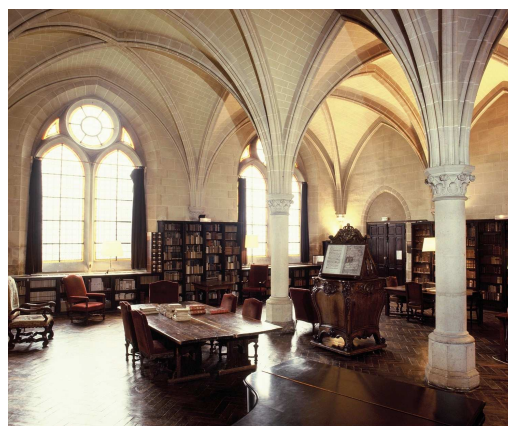
Bibliothèque littéraire de Royaumont

En plus de la belle programmation de concerts et de spectacles chorégraphiques, les spectateurs pourront devenir visiteurs et participer à des visites à thèmes sur l'abbaye. Ils pourront également profiter de l'ouverture exceptionnelle au public de la bibliothèque littéraire Henry et Isabel Goüin et de la bibliothèque musicale François-Lang, dans laquelle sera présentée une exposition sur le Ballet de la Merlaison et l'histoire de sa re-création à Royaumont.