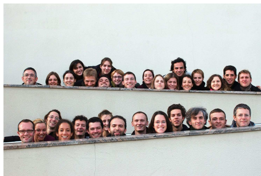
Les Cris de Paris

L'ensemble Recherche, que l'on retrouvera dimanche dans le concert Pulvérisation du langage, travaille lui aussi sur les œuvres d'aujourd'hui et sur le regard que l'on porte sur les œuvres anciennes. Créé en 1998, Les Cris de Paris est un chœur de chambre qui s'est spécialisé dans la musique du XVI e siècle à nos jours et apporte un regard pédagogique et divertissant sur des œuvres souvent exigeantes qu'il met ainsi à la portée de tous.