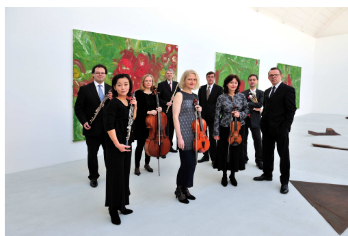
Ensemble Recherche

L'ensemble Recherche, constitué pour ce programme de huit musiciens solistes, occupe une place déterminante sur la scène musicale internationale. Avec plus de 500 créations depuis sa fondation en 1985, il a beaucoup contribué au développement du répertoire de musique de chambre. Il s'est spécialisé dans la musique de la fin du XIX e siècle et du XX e siècle mais travaille également sur le regard contemporain porté sur la musique d'avant 1700.