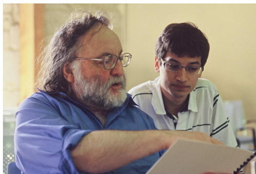
Brian Ferneyhough