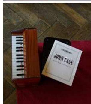
Piano Jouet